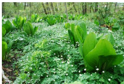
水芭蕉・ニリンソウ

また鏡池に映える戸隠連峰も早朝の風のない日は見事で戸隠連峰の岩峰は見ごたえのある景色です。